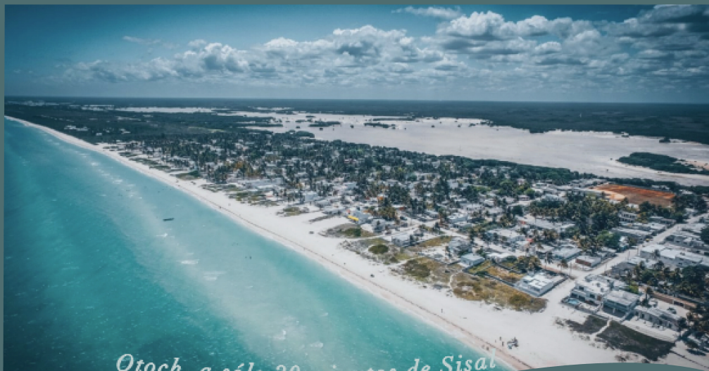
Otoch, a sólo 20 minutos de Sisal

OTOCH ES UN DESARROLLO RODEADO POR DIVERSIDAD NATURAL, COMO DOS RESERVAS NATURALES, UN APACIBLE MAR DE AGUAS TURQUESAS, ASÍ COMO ARRECIFE DE CORAL Y EL ENCANTO DEL PUEBLO PESQUERO EN SISAL; LO QUE LO HACE MUY LLAMATIVO PARA AMANTES DEL ECOTURISMO.